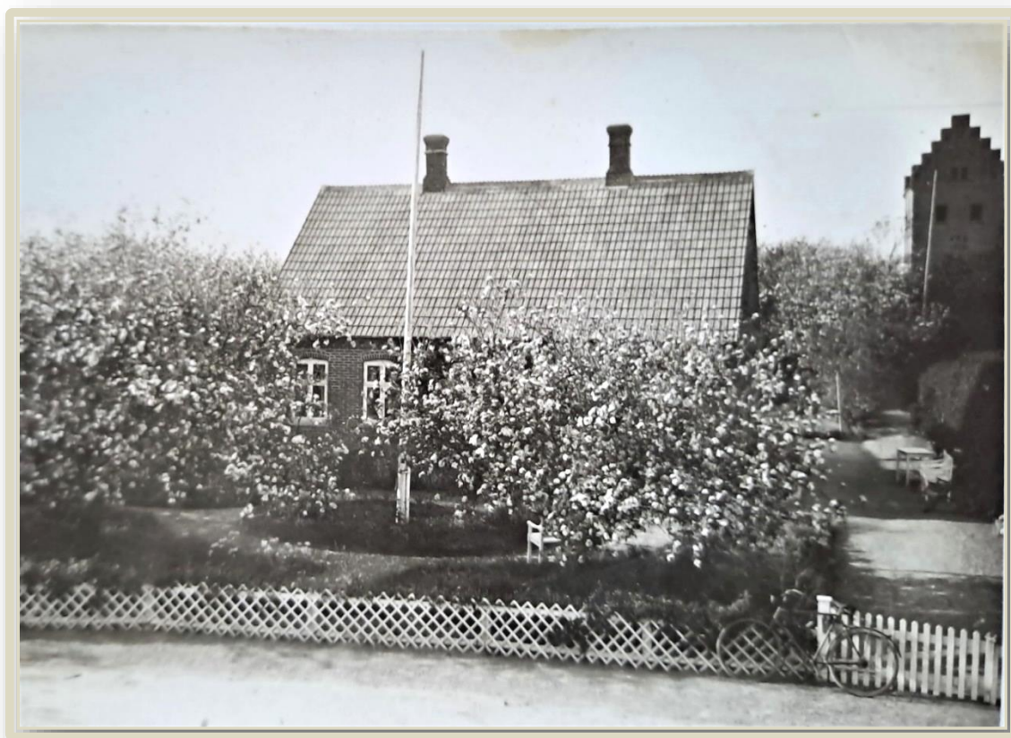
Åbyvej 8. Hundstrup. Foto ca 1950.

Skribenter: Harry Jakobsen og Ivan Rasmussen