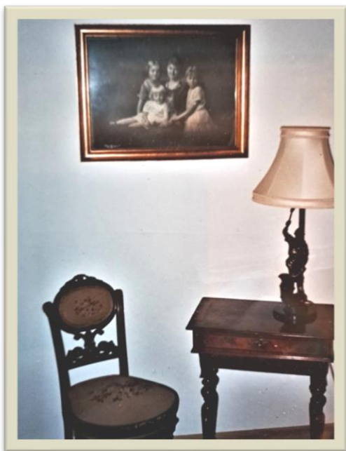
Ellen Larsen i sit lille museum på førstesalen i Huset på Åbyvej 8, Hundstrup. Interiøret er som det var i hendes barndomshjem. Foto sidste halvdel af år 2000.