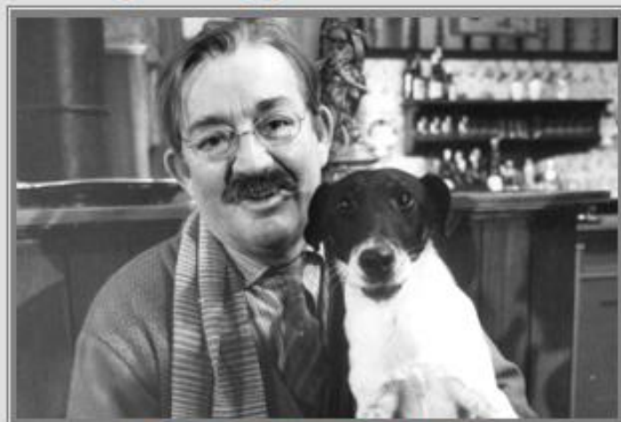
Om "KVIK" og personerne i Matador