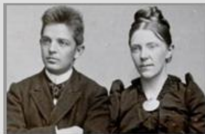
Carl Nielsen og hustru Anna