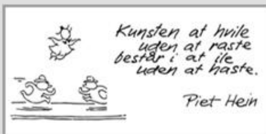
Piet Hein om tid...